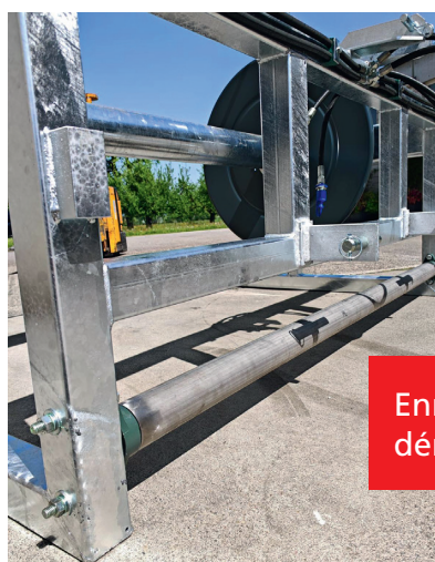
Enrouleur avec rouleau dérouleur