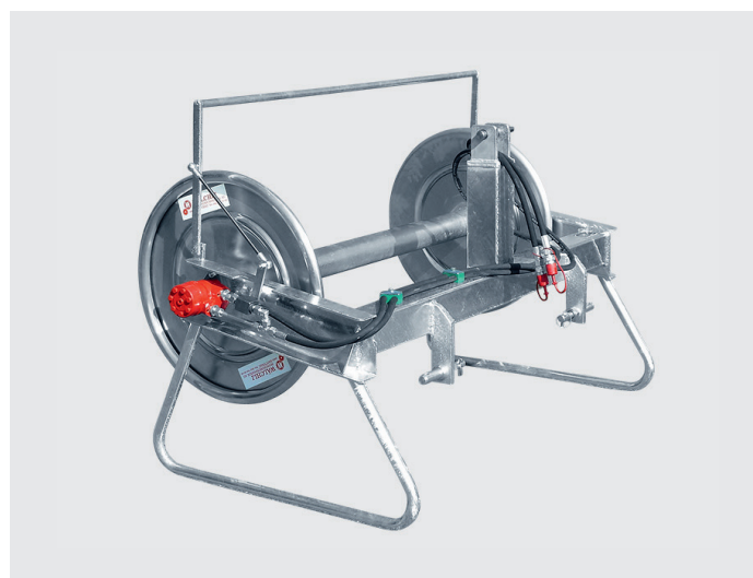
Enrouleur SHW 400 avec entraînement hydraulique et attelage à 3-points

La distribution du purin rationnelle et précise avec les enrouleurs WÄLCHLI, les tuyaux haute-pression et les distributeurs. Les appareils idéaux pour vous.