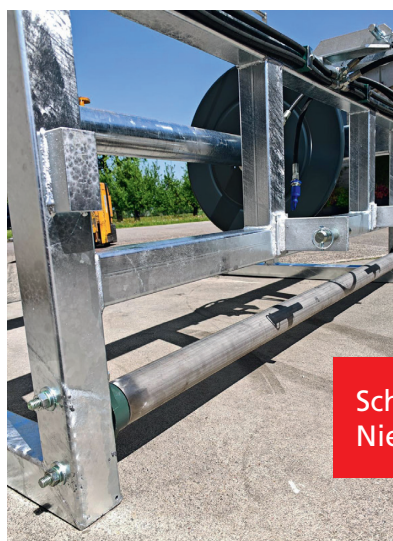
Schlauchhaspel mit Niederhalterolle