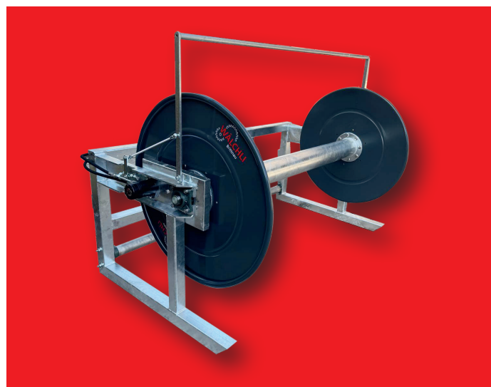
Schlauchhaspel SH 1000, extrabreite Ausführung, mit Hydraulik-Antrieb (2 Hydraulik-Motoren) und Dreipunktaufhängung