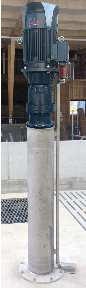
Erhöhte Montage auf Konsole im Laufstall