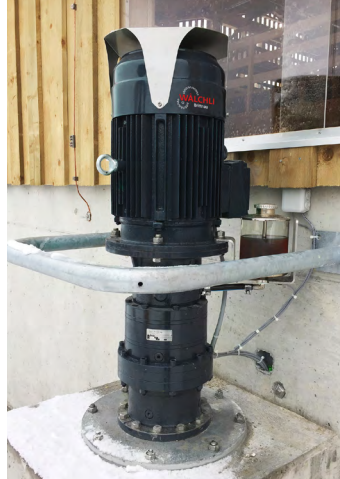
Antrieb direkt auf der Grubendecke