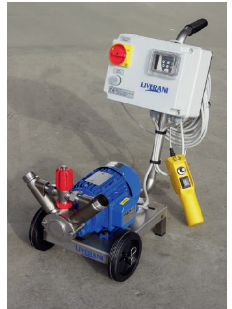
Impellerpumpe 2000 l/h Druck bis 3 bar