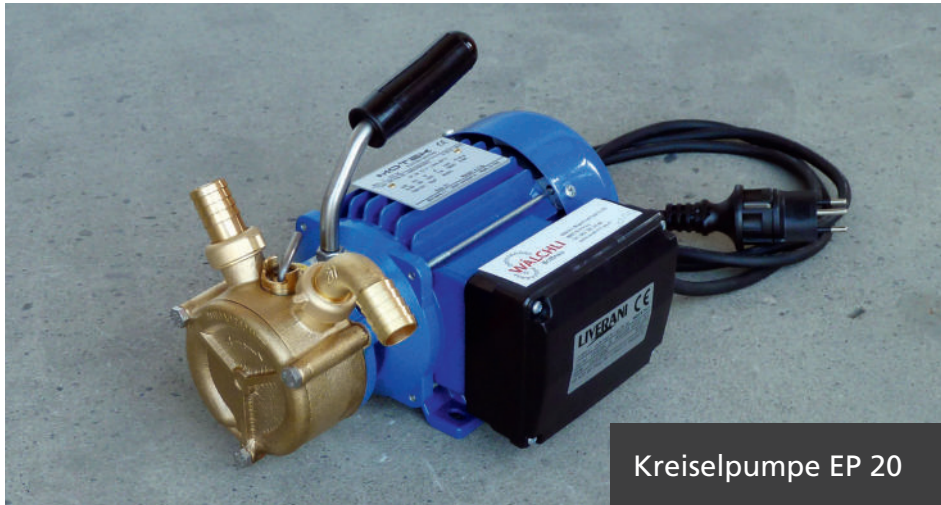
Kreiselpumpe EP 20

Flüssigkeitspumpen für sämtliche Fruchtsäfte und Maischen