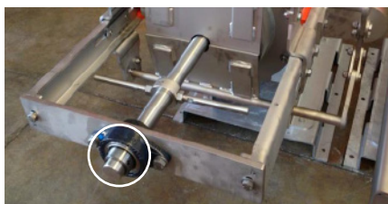
Palier avant – modèle PROFI