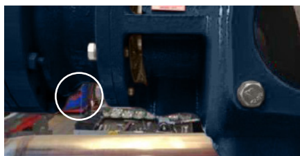
Fenêtre d'inspection – contrôle d'étanchéité