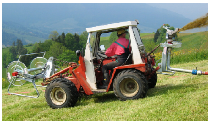
Schlauchhaspel SHW 400 und Elektroverteiler