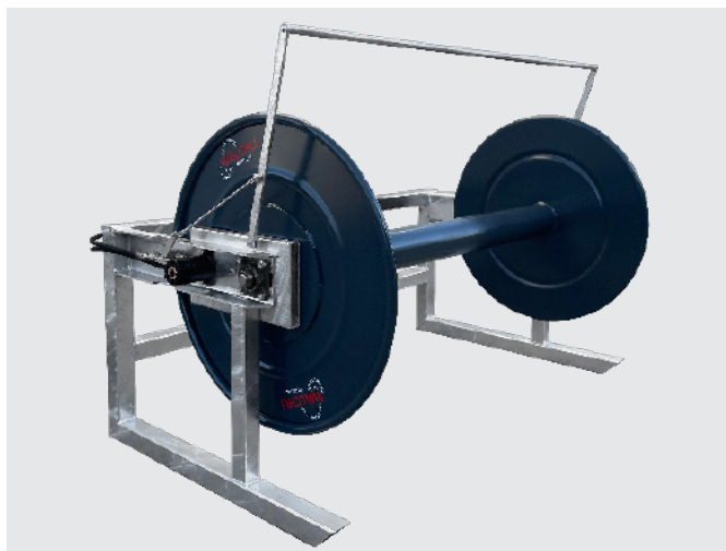
Schlauchhaspel SH 1000, extrabreite Ausführung, mit Hydraulik-Antrieb (2 Hydraulik-Motoren) und Dreipunktaufhängung