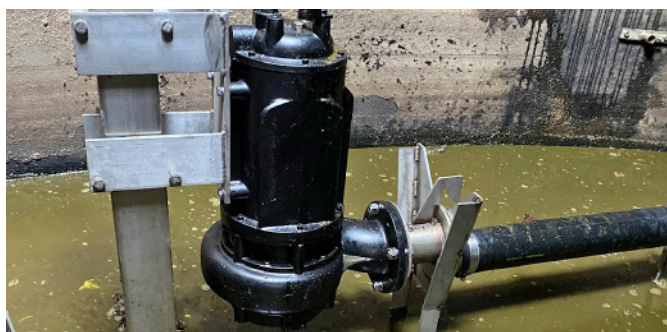
Pompe à purin immergée en action