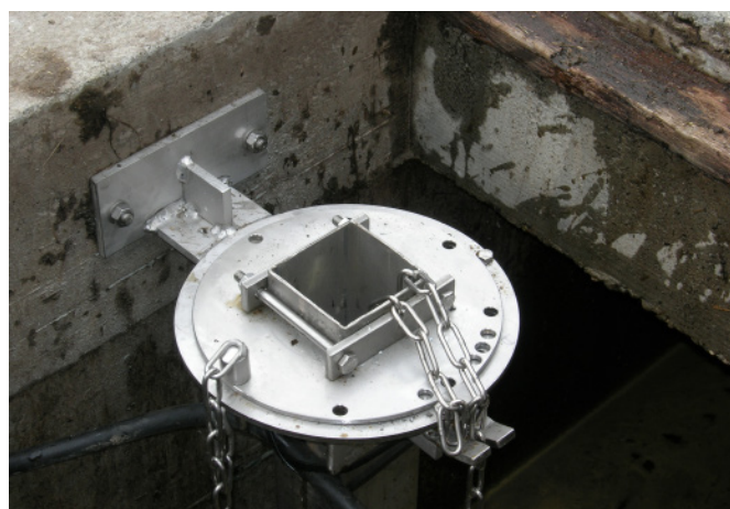
Absenk- und Schwenkvorrichtung – versenkte Ausführung