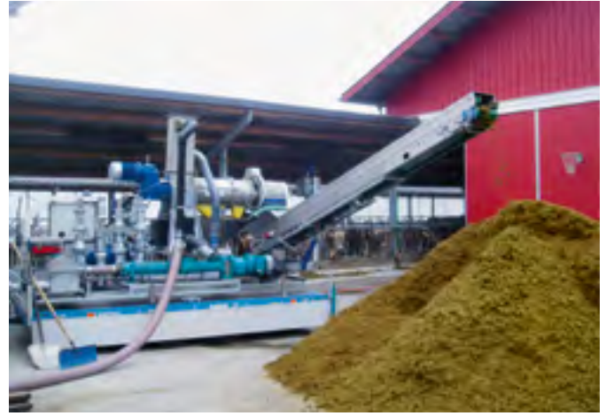
Mobile Anlage zur Auftrennung (Separierung) von Hofdünger in flüssige und feste Bestandteile.

21% und bei Kalium sogar 24%. Durch den Ausbau industrieller wie auch landwirtschaftlicher Biogasanlagen könnte dieser Anteil in Zukunft markant gesteigert werden, betonen die Autorinnen und Autoren der BioCircle-Studie. Sie verweisen in diesem Zusammenhang auf die steigenden Preise für Mineraldünger. Es sei nicht nur aus ökologischer, sondern auch aus wirtschaftlicher Sicht ratsam, die Vermarktung von Gärresten aus Biogasanlagen zu steigern.