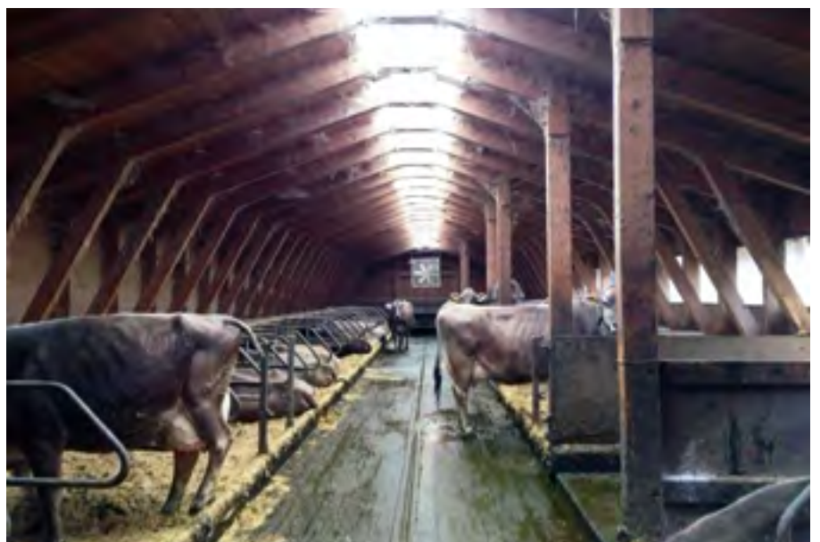
Kleinvieh macht Mist, Grossvieh erst recht: In der Schweiz gibt es rund 1,5 Mio. Rinder und 1,3 Mio. Schweine. Der allergrösste Anteil an Hofdünger fällt in Form von Rinder- und Schweinegülle an.

anlagen verbrannt oder einfach kompostiert. Das BioCircle-Team hat errechnet, dass mit den Gärresten aus industriellen Biogasanlagen schon heute ein erheblicher Teil des Düngemittelbedarfs der Schweizer Landwirtschaft gedeckt und damit der Import von (in Bergwerken abgebautem oder chemisch hergestelltem) Mineraldünger reduziert wird: Bei Stickstoff werden auf dem Weg 12% des landesweiten Bedarfs gedeckt, bei Phosphor