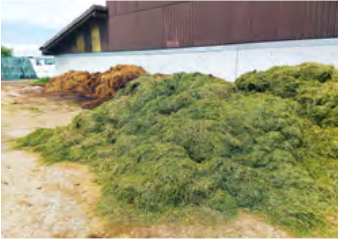
Auch landwirtschaftliche Nebenprodukte wie Pflanzenreste können in Biogasanlagen vergärt werden.