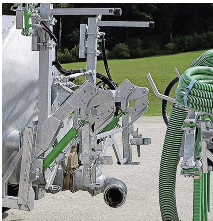
Der Schnellkuppler am Güllefass für den Kombi-Schlepplachschlauch der Firma Wälchli.